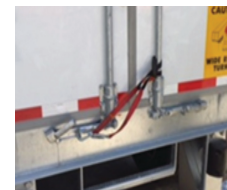
Ременная петля закреплена